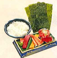
たてやま手巻き寿司セット ※2~3人前 ・まぐろ、サーモン、いくら、 たまご、ネギとろ、蒸し海老、 きゅうり、のり、しやり ¥1,980