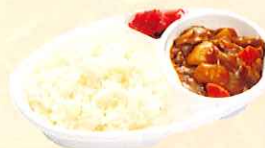
自家製カレーライス ¥650