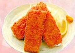
いかフライ 三枚 ¥570