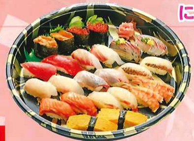
贅沢にぎり寿司セット 十二種入り合計二十四貫 ¥2,980