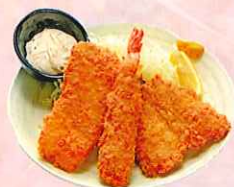
ミックスフライ ※アジ一枚、 イカー一枚、大海老一尾 合計三点 ¥650