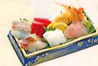
たてやまお刺身七点盛り ・三崎まぐろ、サーモン、 真鯛、赤えび、いか、ホタテ、 他一点 ¥2,300