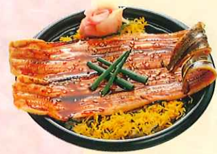
煮穴子丼 (大丼) ¥750