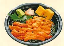
うに丼 (小丼) ¥1,100