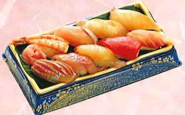
づけにぎり寿司九貫 (三崎まぐろ、真鯛、生えび、 他六貫) ¥1,000