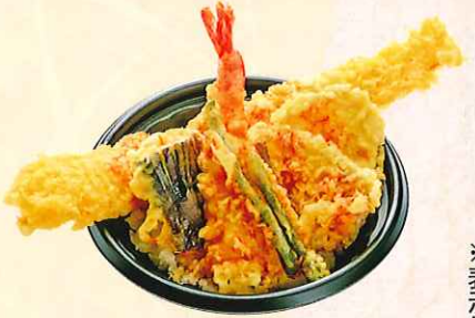
天盛丼 (大丼) ¥850