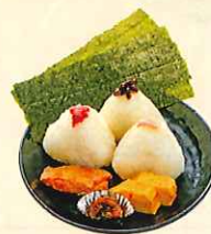
おにぎり三種セット ・さけ、 こんぶ、梅、小鉢、厚焼き玉子、 自家製鶏の唐揚げ入り ¥550