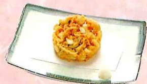
貝と海老の五種かき揚げ ¥500