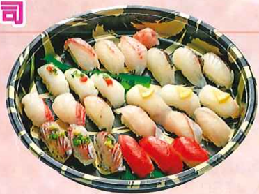
豪華にぎり寿司セット 八種入り合計二十四貫 ¥2,380