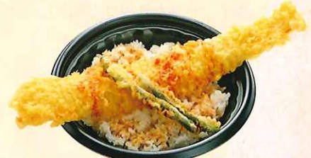
大穴子天丼 (大丼) ¥700