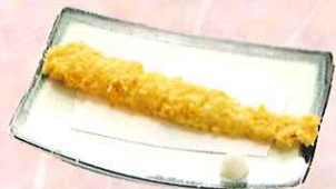
穴子天ぷら 一尾 ¥550