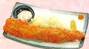
穴子フライ 一尾 ¥550