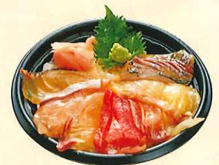
地魚入りづけ丼 (大丼) ¥750