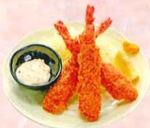
大海老フライ 三尾 ¥700