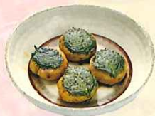
さんが焼き ※四枚入 ¥500