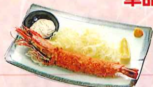
おぼけ海老フライ ¥1,100