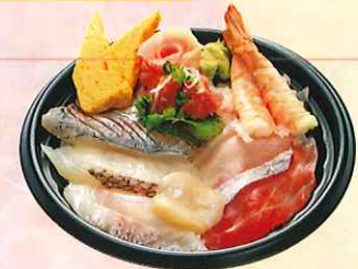
たてやま海鮮丼 (大丼) ¥850