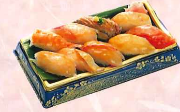
味噌づけにぎり寿司九貫 (三崎まぐろ、真鯛、生えび、 他六貫) ¥1,000