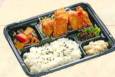
自家製鶏の唐揚げ ※五ヶ入 ¥780