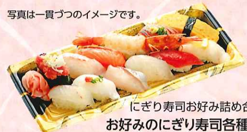
にぎり寿司お好み詰め合わせ お好みのにぎり寿司各種二貫以上 合計 十貫以上からのご注文となります。