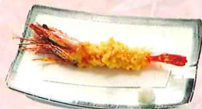
おぼけ海老天ぷら ¥1,100