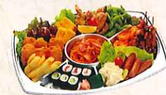
オードブル ¥4,000(4~5人前) 自家製鶏の唐揚げ、いかフライ、 ウインナー、海老フライ、 ポテトサラダ、ポテトフライ、 玉子焼き、枝豆、焼鳥、スパゲッティ、 肉団子、ねぎトロ細巻1本、かつぱ 細巻1本 合計13点