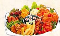
オードブル ¥4,500(4~5人前) 自家製鶏の唐揚げ、いかフライ、 ウインナー、海老チリ、 ポテトサラダ、ポテトフライ、 玉子焼き、枝豆、焼鳥、スパゲッティ、 肉団子、ねぎトロ細巻2本、かつぱ 細巻2本 合計13点