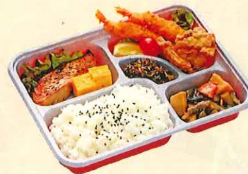
たてやま幕ノ内弁当 ¥850