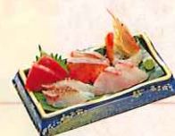
たてやまお刺身五点盛り ・三崎まぐろ、サーモン、 真鯛、赤えび、他一点 ¥1,500