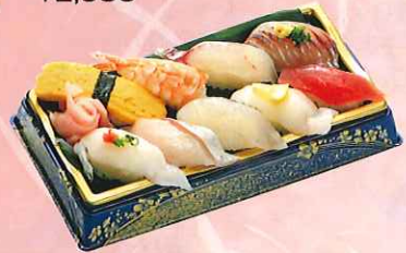
おまかせにぎり寿司九貫 (三崎まぐろ、真鯛、生エビ、 厚焼き玉子、他五貫) ¥1,000