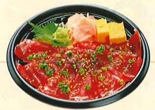
三崎まぐろづけ丼 (大丼) ¥700