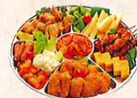
オードブル ¥3,500(3~4人前) 自家製鶏の唐揚げ、いかフライ、 ウインナー、海老チリ、 ポテトサラダ、ポテトフライ、 玉子焼き、枝豆、焼鳥、スパゲッティ 合計10点