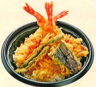
大海老天丼 (大丼) ¥850