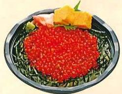
いくら丼 (小丼) ¥950