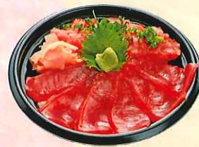
三崎まぐろづくし丼 (大丼) ¥750