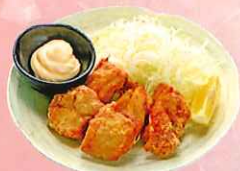
自家製鶏の唐揚げ ※五ヶ入 ¥600