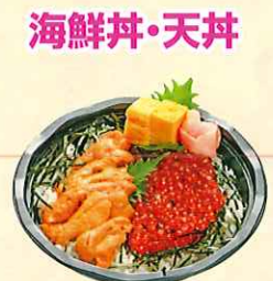
うにいくら丼 (小丼) ¥1,100