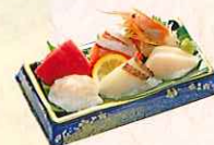
たてやまお刺身六点盛り ・三崎まぐろ、三崎カジキまぐろ、 サーモン、真鯛、赤えび、他一点 ¥1,750