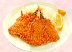
房総アジフライ 二枚 ¥600